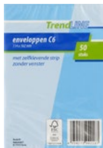
Enveloppen C6 Trendline, pak 50 stuks, Art. nr. 95100000