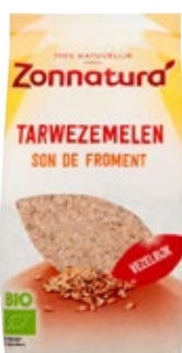
Tarwezemelen Zonnatura, pak 200 g, Art. nr. 95655210