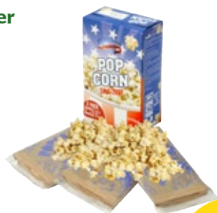
Magnetron popcorn zout American, doos 3 zak, Art. nr. 95266940