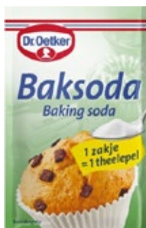
Baksoda Dr. Oetker, pak 5 x 25 g, Art. nr. 95261962