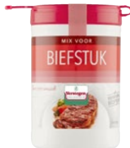
Biefstuk kruidenmix Verstegen, bus 70 g, Art. nr. 95839516