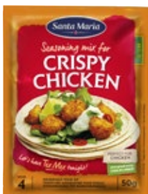
Seasoning mix for crispy chicken Santa Maria, zak 50 g, Art. nr. 95078844