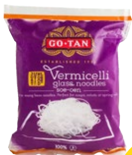
Glas noodles Go-Tan, zak 100 g, Art. nr. 95221058