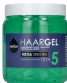
Styling gel mega strong Derlon, pot 500 ml, Art. nr. 95646891